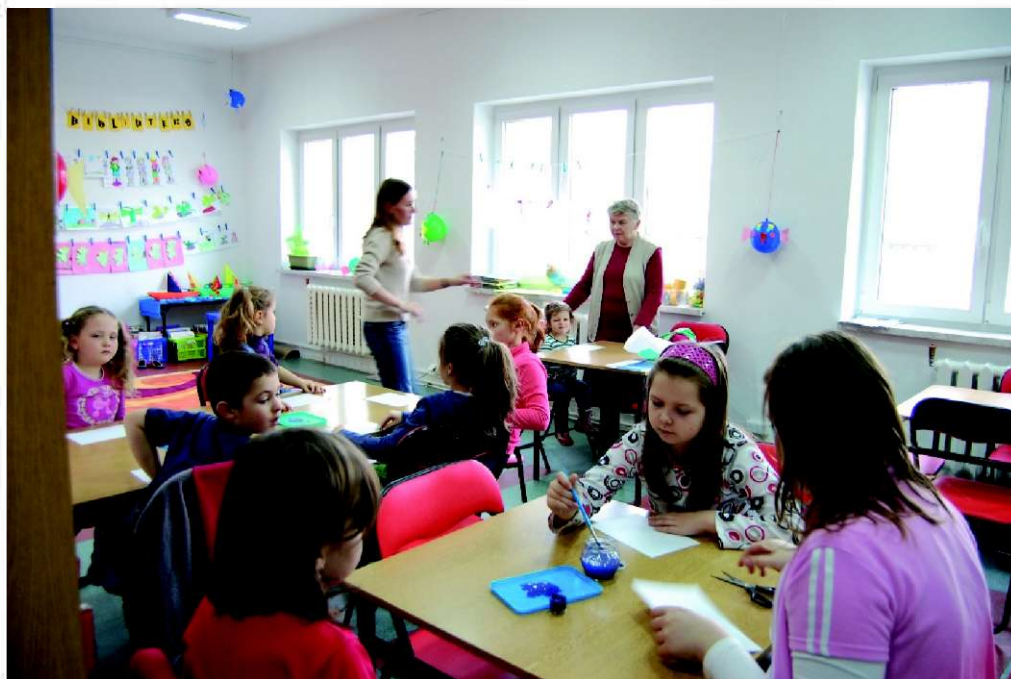
Malowanie „wodnych obrazów”

Na kiepską pogodę – dobra książka, na nudę – biblioteka. Takie przesłanie chcielibyśmy przekazać na naszych zajęciach. Zapraszając najmłodszych czytelników staraliśmy się stworzyć im miłą i przyjazną atmosferę, żeby poczuli się u nas jak w miejscu stworzonym specjalnie dla nich. Dlatego mamy nadzieję, że będą nas teraz częściej odwiedzać.