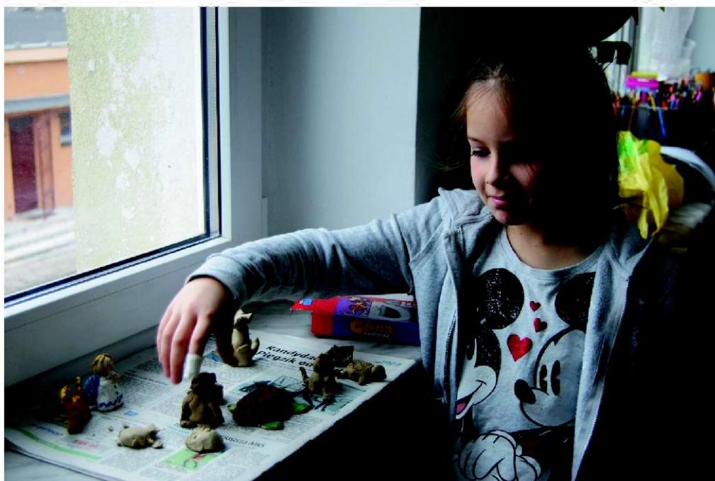
Wysuszone figurki z gliny można już pomalować

Dlaczego balon pęka? Jak działa fontanna? Czy istnieje życie bez wody? Ile kolorów ma ogień? Tegoroczne ferie upłynęły pod znakiem czterech ziemskich żywiołów. Przez dwa tygodnie uczestnicy zajęć w bibliotece poznawali fascynujące siły natury zarówno w teorii jak i w praktyce, starając się znaleźć odpowiedzi na trudne pytania. Dzieci, pod okiem opiekunek przeprowadzały eksperymenty naukowe, tropiły żywioły w życiu codziennym, a bardziej dociekliwi wertowali książki w poszukiwaniu faktów naukowych. Każde spotkanie zaczynaliśmy od dobrej literatury – bibliotekarka czytała uczestnikom fragmenty powieści dla dzieci. Następnie przychodził czas na rozwijające gry i zabawy. Dzieci tańczyły taniec ognia, poznawały siłę swojego oddechu, udawały się w wyobraźni na wycieczkę do lasu lub do krainy wulkanów. Śpiewom, płaśmom i zabawom nie było końca.